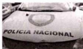
IMAGEN REFERENCIAL DE STIKERS PARA VEHICULOS TIPO PATRULLA